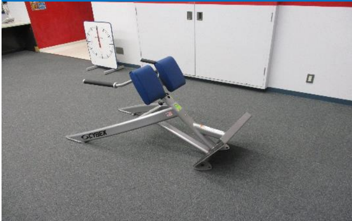
バックエクステンション 1台