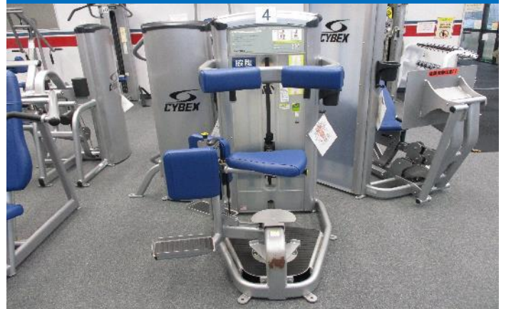
トーンローテーション 1台