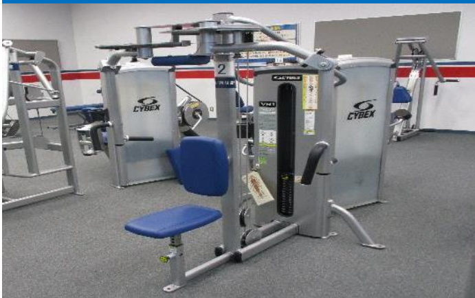
フライ/リアデルト 1台