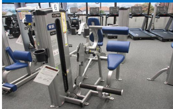
バックエクステンション 1台