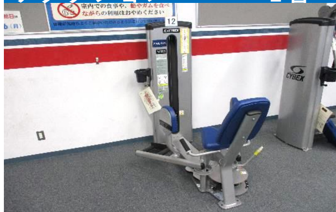
ヒップアブダクション/ アダクション 1台