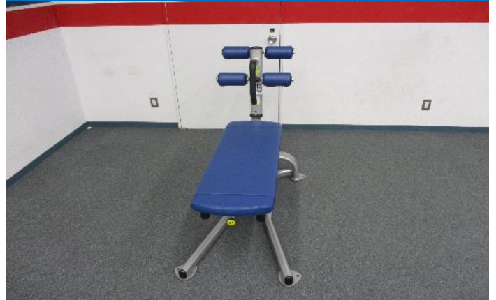
ベントレッグアブドミナル ボード 1台