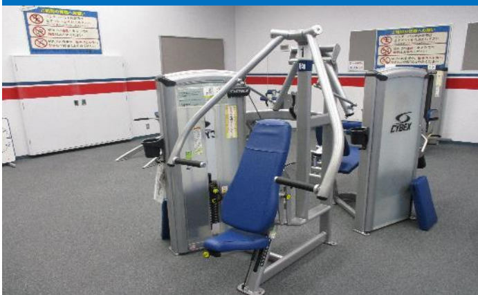
チェストプレス 1台