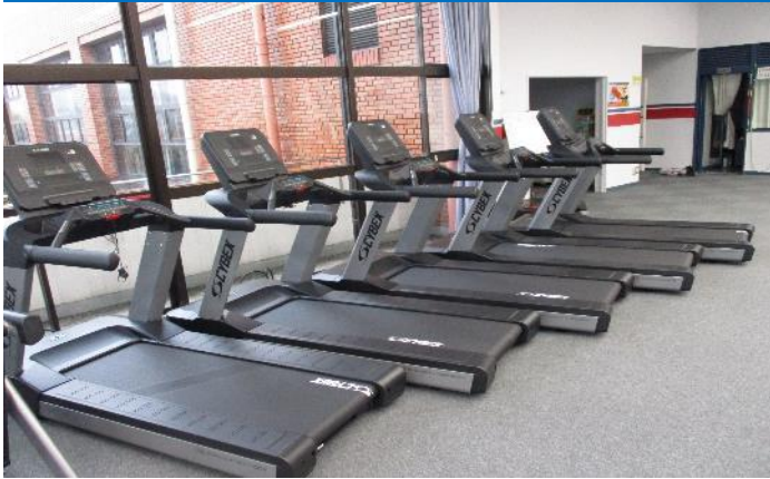
ランニングマシン 5台