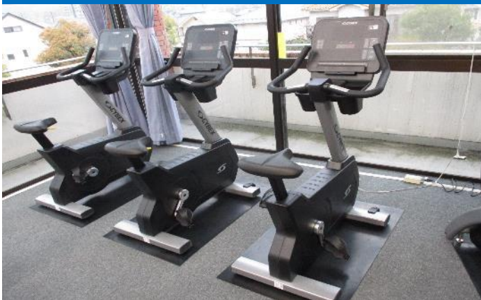
アップライトバイク 3台