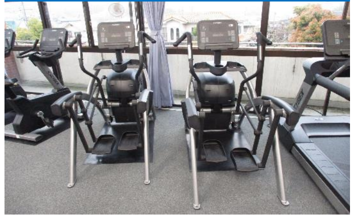
アークトレーナー 2台