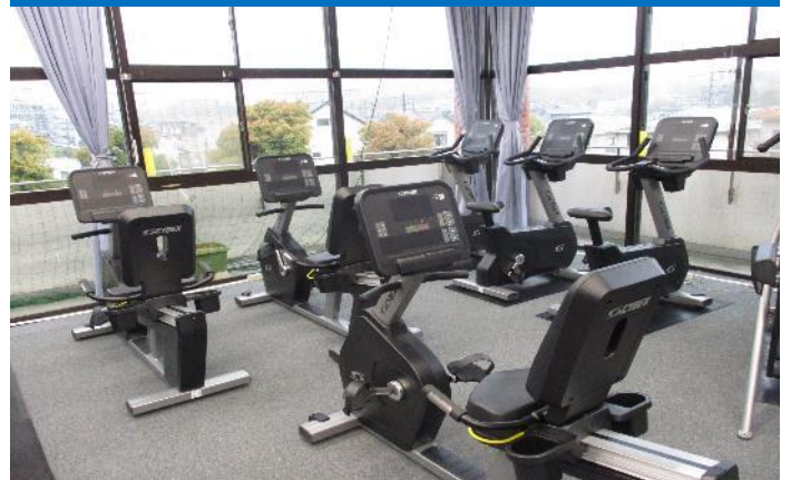
リカレントバイク 3台