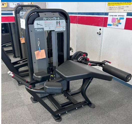
プローンレッグカール