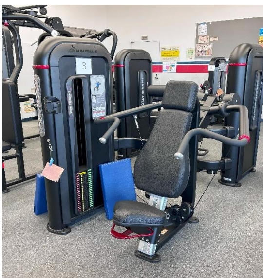
ショルダープレス