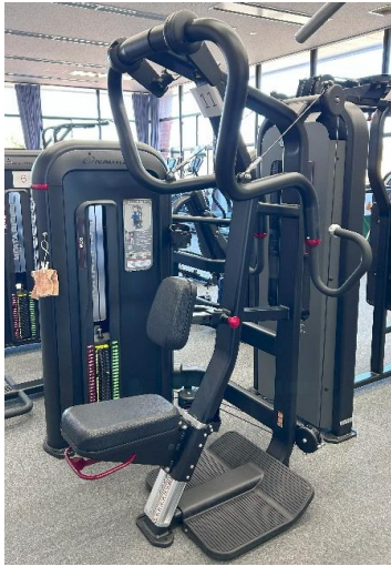
バーディカルロウ