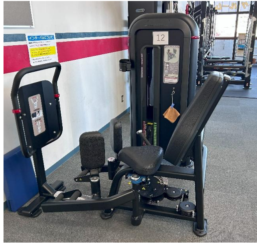
アブダクション/アダクション