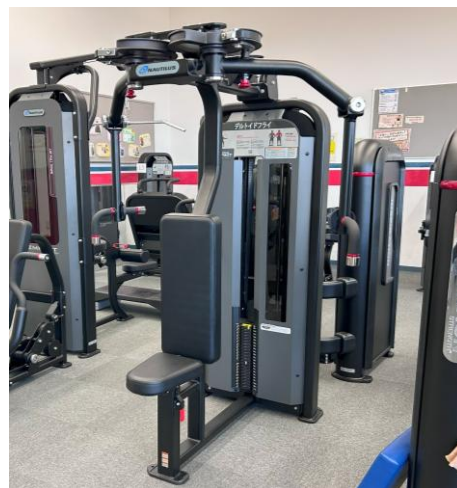
デルトイドフライ