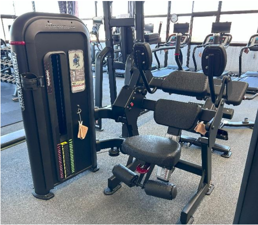
アブドミナルクランチ