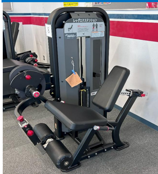
レッグエクステンション