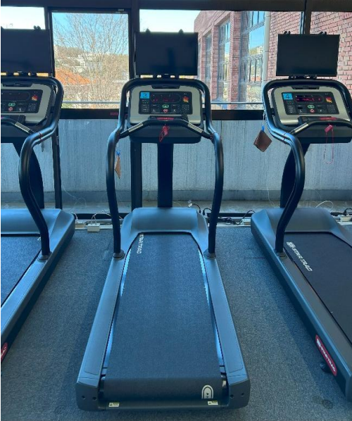
ランニングマシン 5台