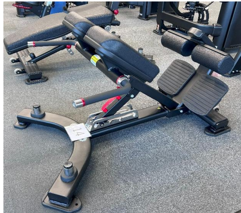
アジャスタブル バックエクステンション