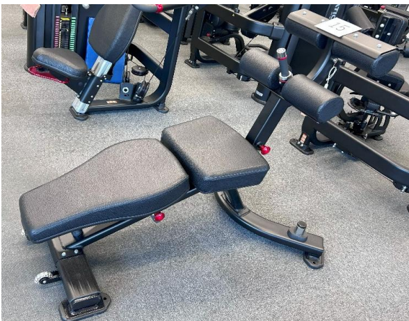
アブドミナルベンチ