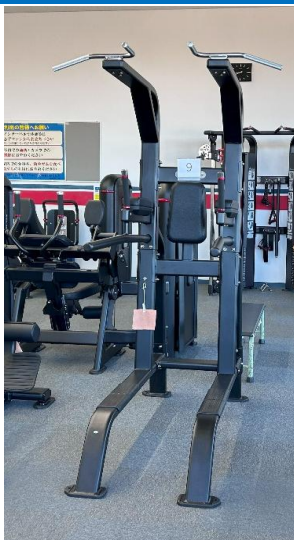
プルアップ/ディップ/レッグレイズ